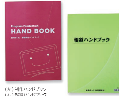
(左)制作ハンドブック (右)報道ハンドブック

放送倫理やモラル、コンプライアンス、権利関係など、各種疑問を具体的事例として各自にフィードバックし、どのような対応をすればよいか、一人ひとりに見解を求めました。それぞれの見解をもとに、放送人として誰のために何をすべきかを考え、話し合いながら自分たちでその答えを導いていく。このような過程を経て、少しずつ「制作ハンドブック」を作り上げていきました。完成した「制作ハンドブック」を使用し、現場部局、協力会社と定期的に勉強会を実施しています。