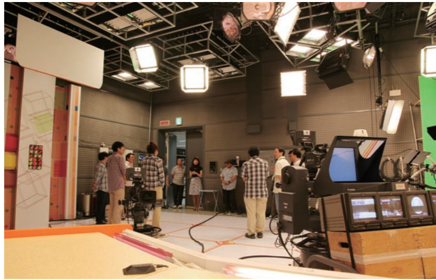
映像制作センター反省会