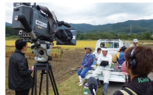
岩手支援ドキュメンタリー撮影風景