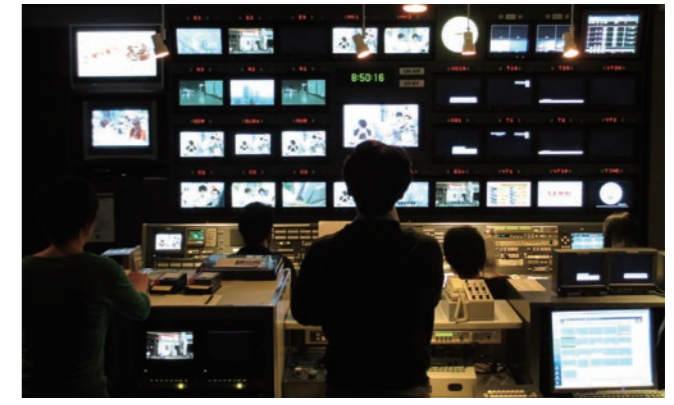
情報制作部 副調整室に監視ディレクターを増員

制作現場の社員、協力会社スタッフへの放送倫理教育も実施しています。これまであった「報道ハンドブック」の更新作業を行い、今年3月に改訂版を発行しました。新たな内容として、現場スタッフの経験をもとにした、取材現場で予想される事例と対処方法の