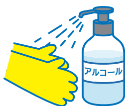
手洗い&手指の消毒